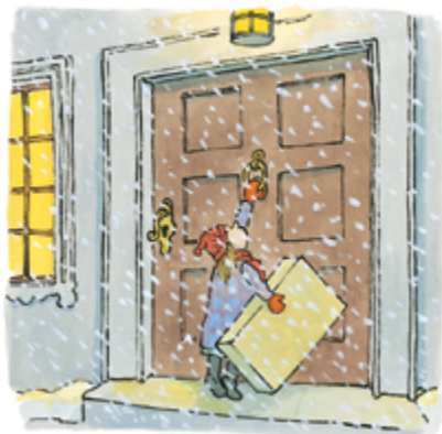
Il·lustració de William Steig. Irene la valenta (Blackie Books).

teca maletes de llibres sobre el tractament de gènere, confegides amb la voluntat d'entusiasmar, interessar per la lectura, reflexionar i parlar dels llibres llegits, des d'on es viuen l'equitat, la corresponsabilitat, la discriminació