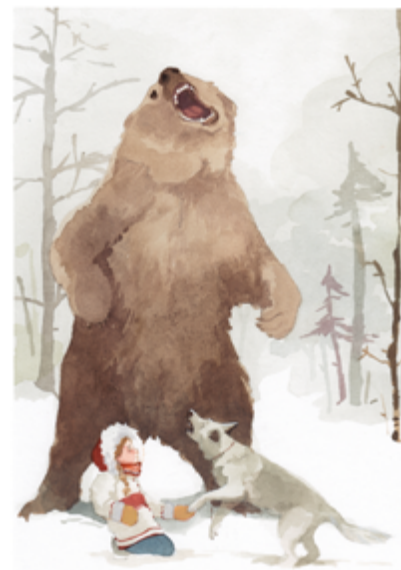
Il·lustració de Zuzanna Celej. Naszka (Nandibú).

La lectura ha de generar interès al lector.