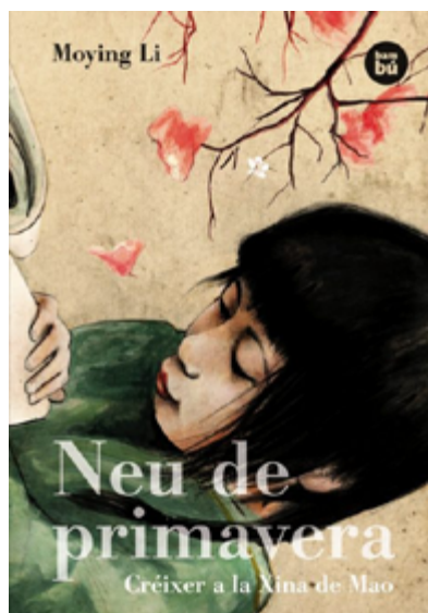
Neu de primavera (Bambú).

Potser hauríem d'haver intuït l'eclosió. Fa anys, vam llegir i ens van fascinar llibres com L'autobús de la Rosa (Barbara Fiore Editora), una biografia il·lustrada de l'activista Rosa Parks; també Pequeños grandes gestos contra la discriminación (Alba), deu senyals protagonitzats per homes i dones que han marcat un abans i un després en la lluita pels drets humans. La col·lecció «Em dic...», editada per Parramón, va trencar motllos incorporant títols dedicats a dones exemplars i poc tractades, i també va innovar la col·lec-