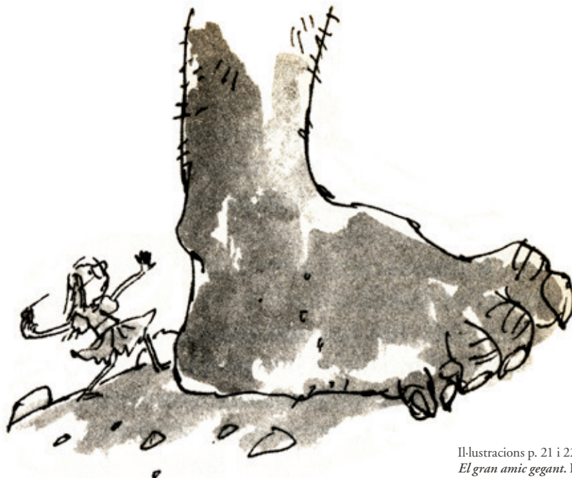
Il·lustracions p. 21 i 22 de Quentin Blake. El gran amic gegant. El Petit Esparver