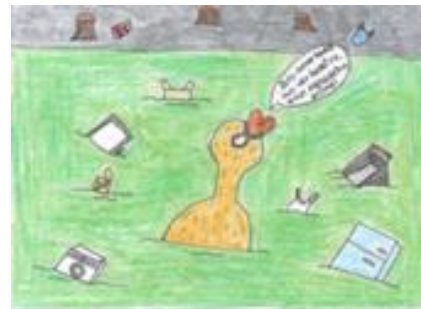
Ángela Fonseca (Cambre- A Coruña)