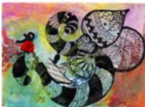
Garazi Aldama (Zarautz-Guipúzcoa)