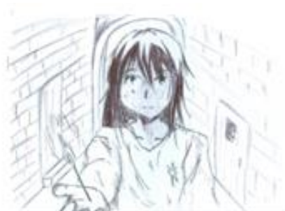
Katia Tojo (Stgo. Compostela-A Coruña)